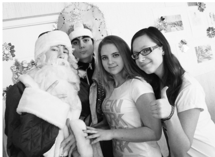
В прошлый раз школьный новогодний КВН прошел на отлично! Что же приготовили старшеклассники в этом году?

поменяла тематику на более креативную, чем «Новый год». Шутить о банальном сложно, потому что до нас столько всего сказано на эту тему!» Нелегко в процессе подготовки также пришлось новичкам. Еще бы, ведь они первый раз