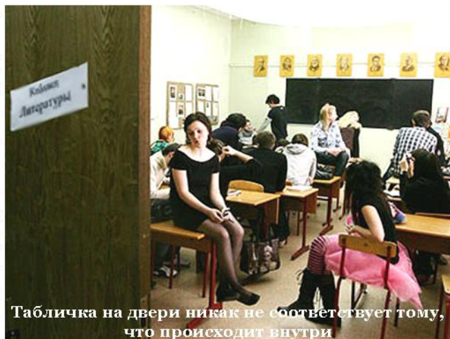
Табличка на двери никак не соответствует тому, что происходит внутри

Педагоги считают, что этот сериал вообще следует запретить, ведь там оскорбляют учителей, ругаются матом прямо на уроке, курят и пьют. «Этот сериал показывает только одну сторону школьной жизни – худшую. Автор сериала своей работой «пшоёт» на учителей и систему образования России. И это в Год Учителя, когда Президент России Дмитрий Анатольевич Медведев призвал народ сделать всё для повышения престижа педагога! Какой там престиж, когда, по мнению Валерии Гай Германики, ученики не слушаются учителя, запросто могут выругаться на его уроке, унижить, оскорбить и оклеветать его. Поражает тот факт, что из государственного бюджета на съёмки одной серии «Школы» было потрачено 90 тысяч $!».