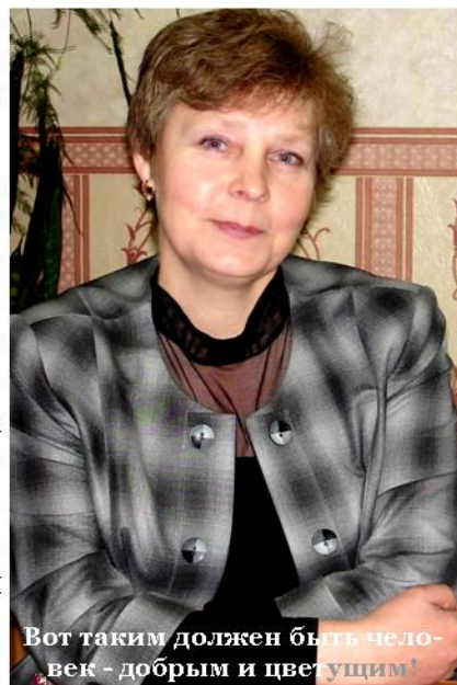
Вот таким должен быть человек - добрым и цветущим!