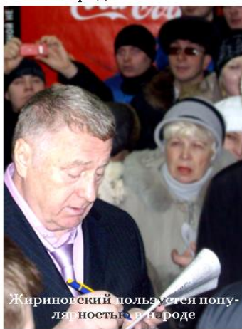
Жириновский пользуется популярностью в народе

Своих кандидатов на эти выборы представили 4 партии: «КПРФ», «Справедливая Россия», «ЛДПР» и «Единая Россия». Кандидаты пытались по-разному завоевать доверие избирателей, а лидеры двух партий лично посетили наш город.