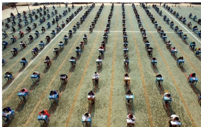
А так государственный экзамен проходит в Китае: открытый воздух и достаточная дистанция между учениками

Как вы уже успели заметить, экзаменационные системы России и Великобритании схо-