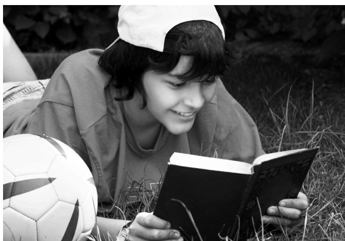
Среди молодежи чтение становится популярным всё меньше. Почему?

Но я считаю, что в этом виноваты не только сами молодые люди, но и те, кто способен привлечь их к чтению. Современная литература не радует фамилиями и не формирует