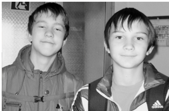
«Я не трус, но я боюсь!» - ребята не любят прививки

зывает больше всего споров, чем от остальных болезней. Проблема вакцинации против гриппа обусловлена природными особенностями этой инфекции обладая мощным потенциалом изменчивости, эта болезнь существует в количестве разновидностей-штаммов, порой весьма серьезно отличающихся друг от друга. Когда вирус из вредоносного штамма впервые попадает в организм человека, у последнего практически гарантированно развивается грипп. Далее же происходит уже описанная реакция иммунной системы. Однако если в организм человека спустя какое-то время вторгнется вирус ранее «незнакомомого» вида гриппа, то весь предыдущий опыт иммунитета способен оказаться практически бесполезным. Поэтому, даже вполне здоровый человек запросто может переболеть гриппом два и более раза в год - если «не повезет» заразиться вирусами из тех видов вирусной болезни, что не знакомы его иммунной системе. В нашей школе, как и в других учебных учреждениях, проводится ежегодная вак-