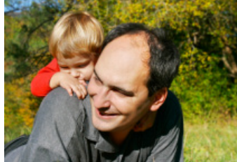
7 ноября - День отца

16 ноября - Всемирный день, посвященный терпимости. А 18 ноября в России официально отмечают день рождения Деда Мороза. Возраст зимнего